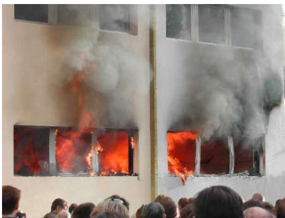
Imagen: Ensayo de fuego en fachada (después de 27 min.)