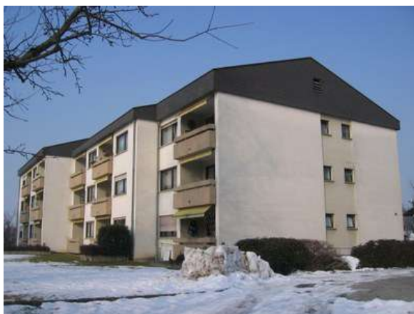
Imagen: Edificio de viviendas Rankweil-Schleipfweg antes de la rehabilitación