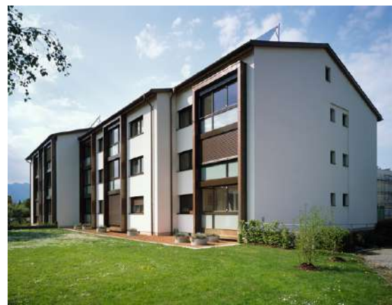
Imagen: Edificio de viviendas Rankweil-Schleipfweg después de la rehabilitación