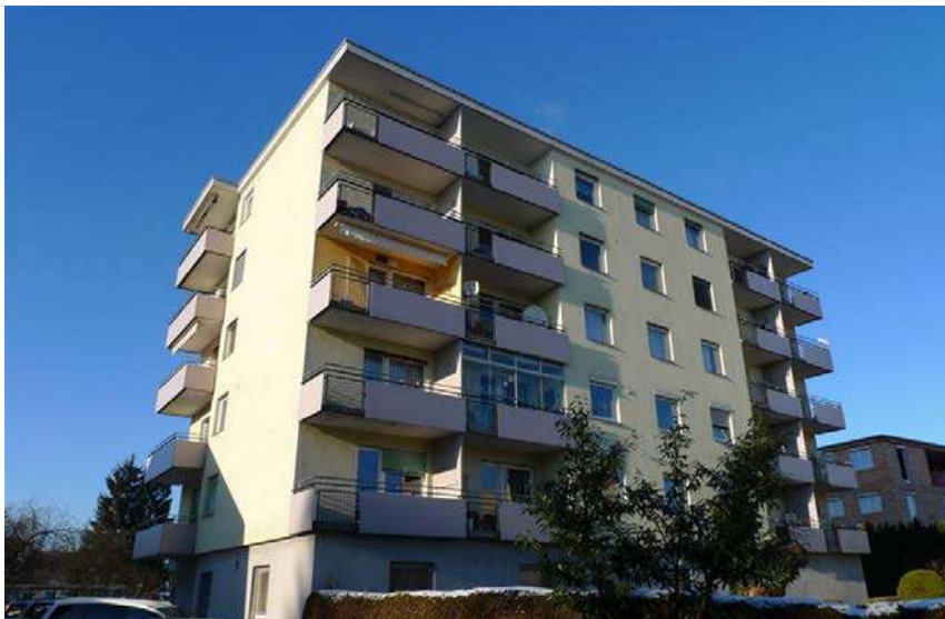
Foto: Edificio de viviendas en Bahnhofstr. 43, 6890 Lustenau con SATE de EPS (año de construcción 1966)

Con una adecuada instalación, los sistemas de aislamiento térmico por el exterior (SATE) han demostrado tener una duración de muchas décadas. De un tiempo a esta parte, en algunos países la colocación de un SATE sobre otro se está utilizando para alcanzar el estado del arte óptimo en lo referente al aislamiento térmico.