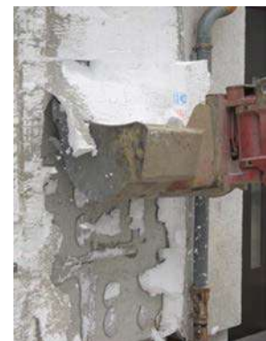
Fotos: Deconstrucción de un SATE