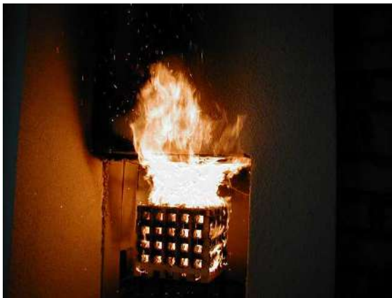
Imagen: Ensayo de fuego en fachada

Se han realizado numerosos ensayos de fuego, entre otras cosas, por distintas autoridades independientes, los cuales han demostrado que los sistemas de aislamiento térmico por el exterior con un espesor de 30 cm tienen una resistencia al fuego de 30 minutos. Esto significa que durante este periodo el fuego no se propaga en la superficie o detrás de la fachada y no hay desprendimiento de trozos o gotas ardiendo.