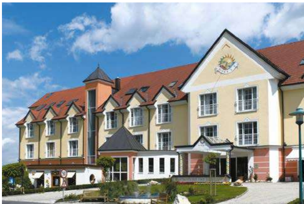
Imagen: Spa hotel Lutzmannsburg

Desde el punto de vista estético, existen edificios más o menos atractivos con o sin SATE instalado. De un tiempo a esta parte, han ido apareciendo nuevos perfiles estéticos para la fachada de EPS como relieves en cercos de ventanas y puertas, alféizares, perfiles de imposta, cornisas y arcos, así como otros elementos decorativos. Con ellos ya es posible incorporar elementos de diseño arquitectónico a la fachada. Ya nada se interpone en lograr el deseado objetivo de lograr unas nuevas casas atractivas o unos agradables edificios restaurados.