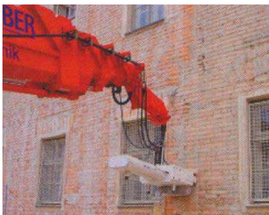
Foto: Fresa en funcionamiento