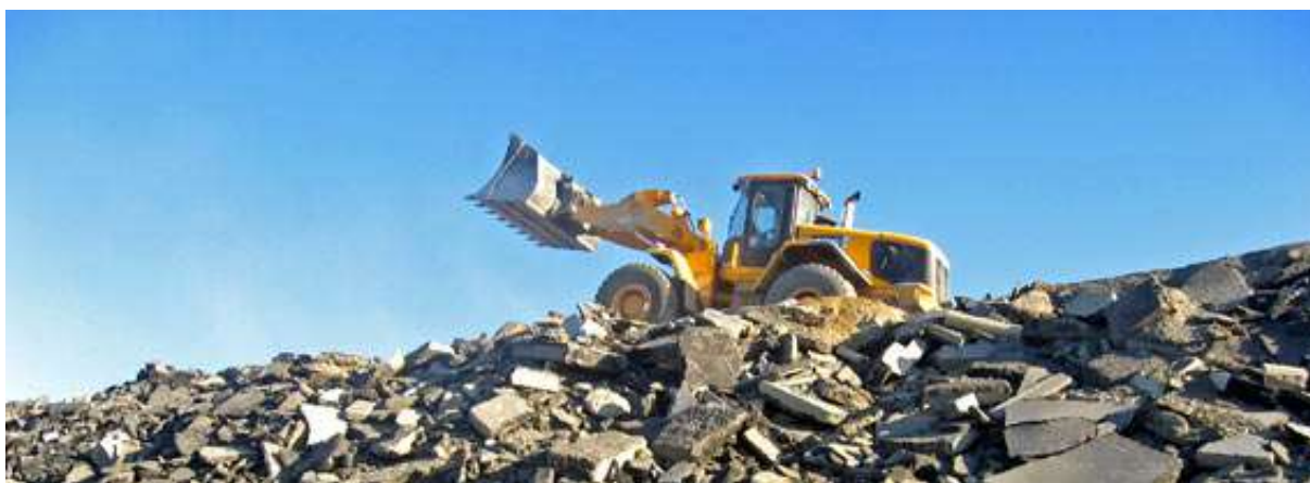
Vertedero de residuos de construcción

Por lo general, los residuos de EPS se reciclan mecánicamente o se utilizan para la recuperación de energía. Son demasiado valiosos para depositarlos en un vertedero. El EPS no tiene ningún efecto sobre las aguas subterráneas y no representa una amenaza para el medio ambiente. Mezclado con escombros de construcción puede depositarse en vertederos de residuos de construcción ordinarios. En este sentido, los residuos de EPS no son diferentes de otros residuos de materiales de aislamiento de origen orgánico como el corcho, fibra de madera o cáñamo.