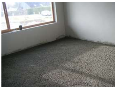
Foto: Relleno de EPS ligado