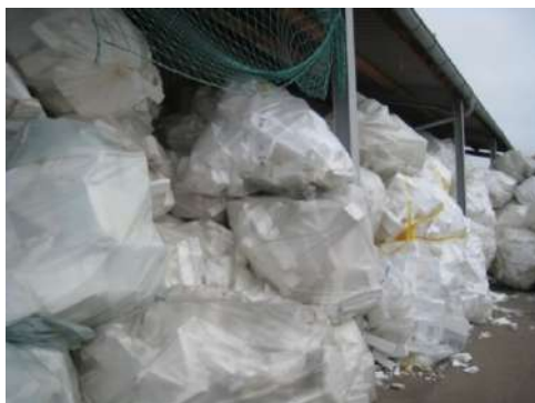
Foto: Bolsas de reciclaje de EPS