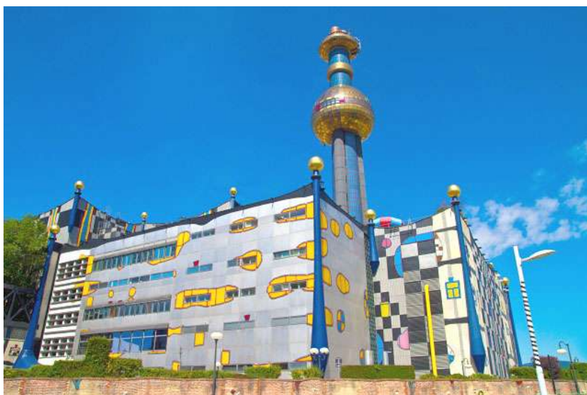
Foto: Planta de incineración de Spittelau

El valor calorífico del EPS se utiliza en las plantas de incineración y en las fábricas de cemento: 1 kg de residuos ahorra 1,3 litros de valioso gasóleo de calefacción. La ventaja de este proceso es que los requisitos relativos a la limpieza de los residuos de EPS son bajos.