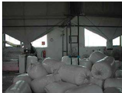
Fotos: Planta de reciclado