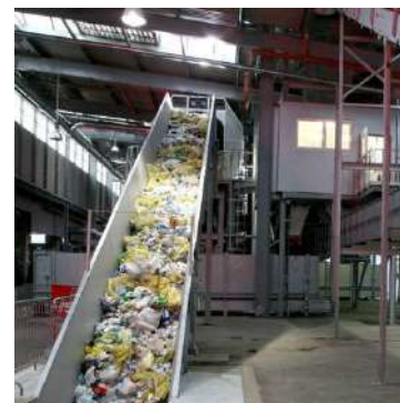
Foto: Planta de clasificación de residuos