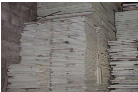
Foto: Planchas de EPS usadas