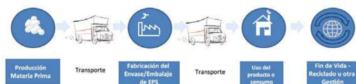
Gráfica 1: Etapas consideradas en un ACV, según el estudio (EUMEPS/PWC, 2011)

El ACV tiene como fin identificar todos los impactos ambientales del ciclo de vida completo del producto, desde la fase de extracción y producción de la materia prima, pasando por su adquisición, procesado y transporte hasta su disposición final. Del mismo modo, se analizan también los consumos energéticos, los residuos generados, las emisiones atmosféricas y vertidos durante la fase de producción y uso del producto.